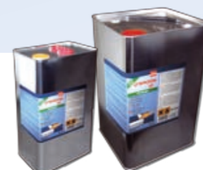
Канистра 10л + 30л